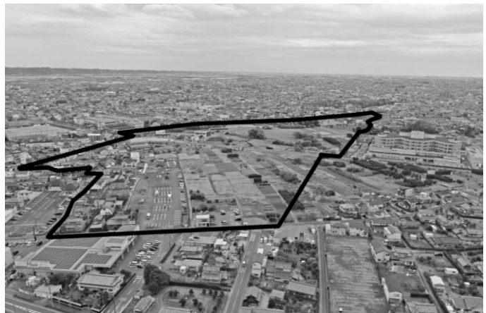
地区北側からの航空写真

令和4年3月31日（木）に測量業者によるUAV（ドローン）計測を実施しました。 この調査によるデータは、土地区画整理事業推進の目的以外には使用しませんので、ご安心ください。